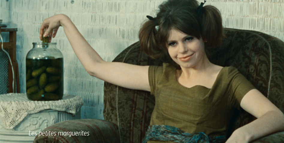
Les petites marguerites