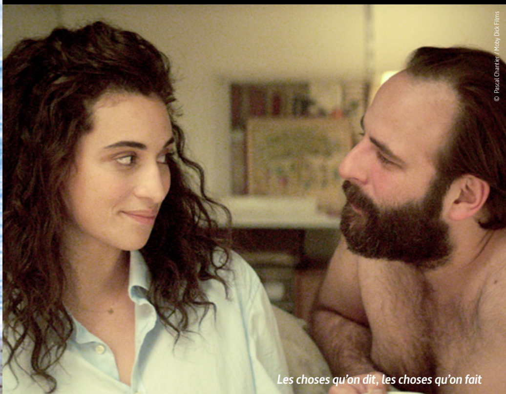
Les choses qu'on dit, les choses qu'on fait