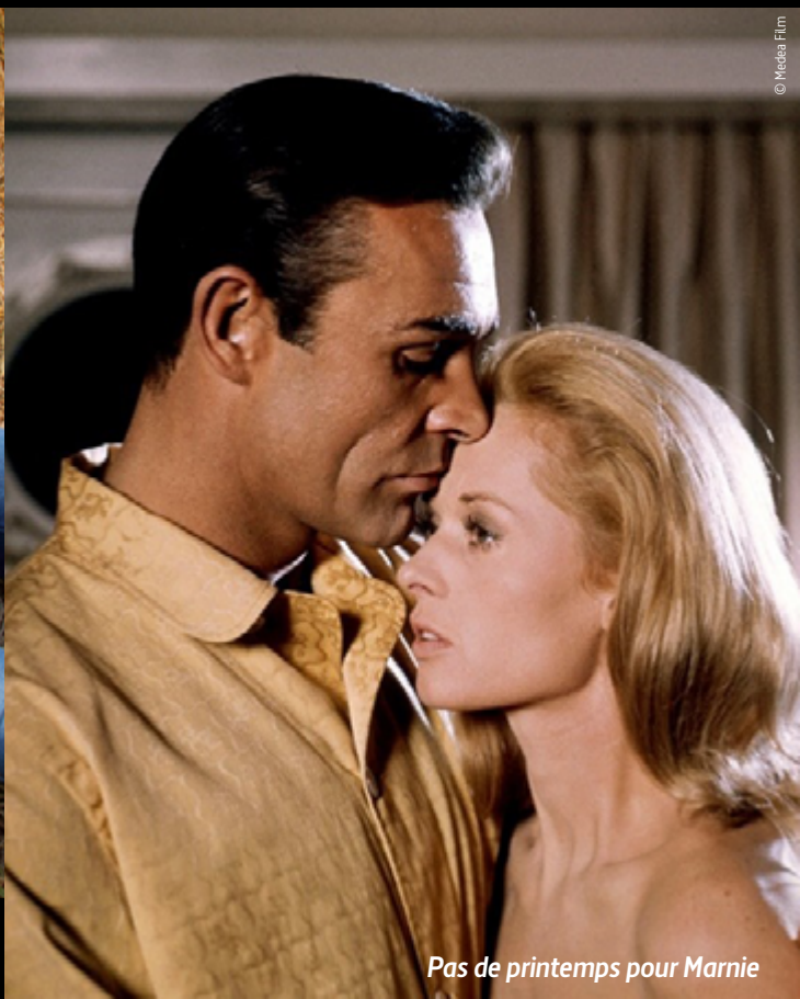
Pas de printemps pour Marnie