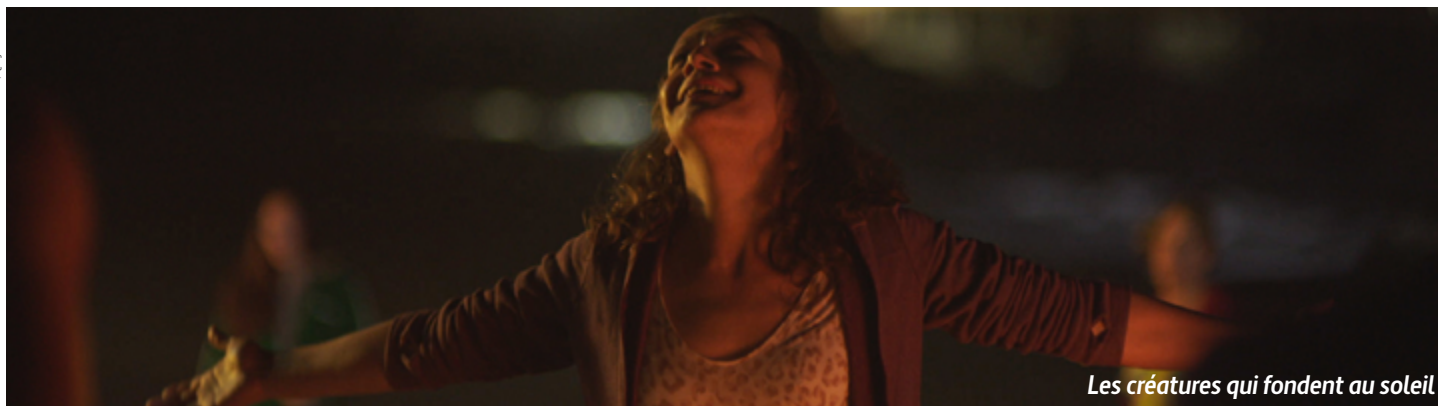
Les créatures qui fondent au soleil