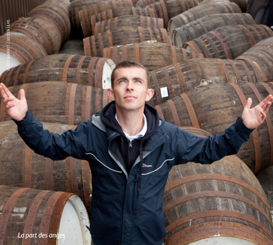
La part des anges