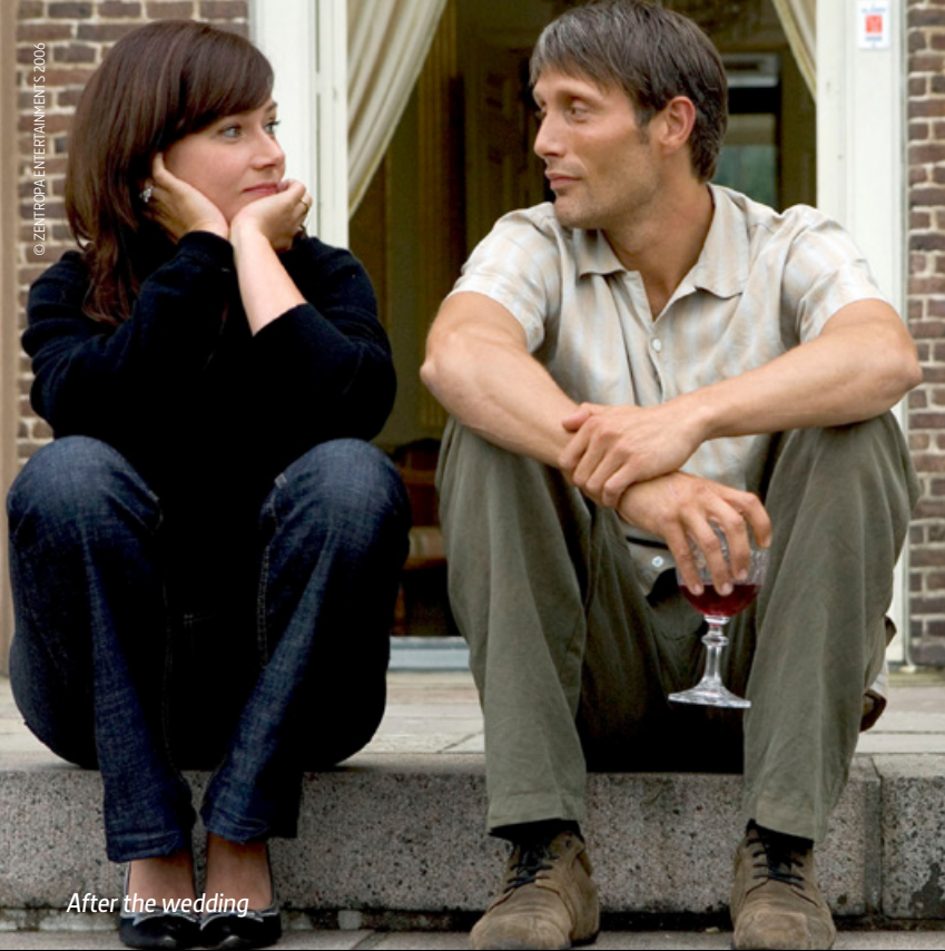
After the wedding