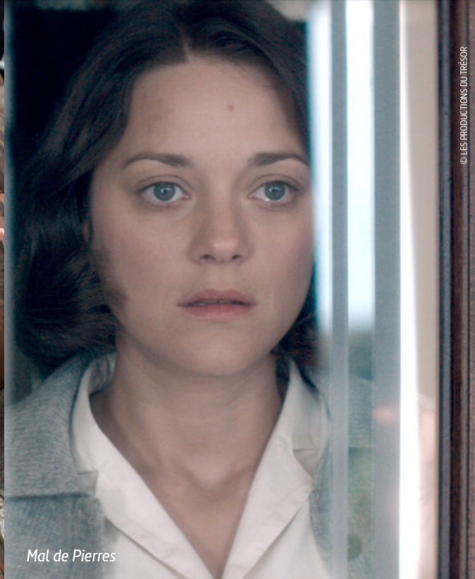
Mal de Pierres