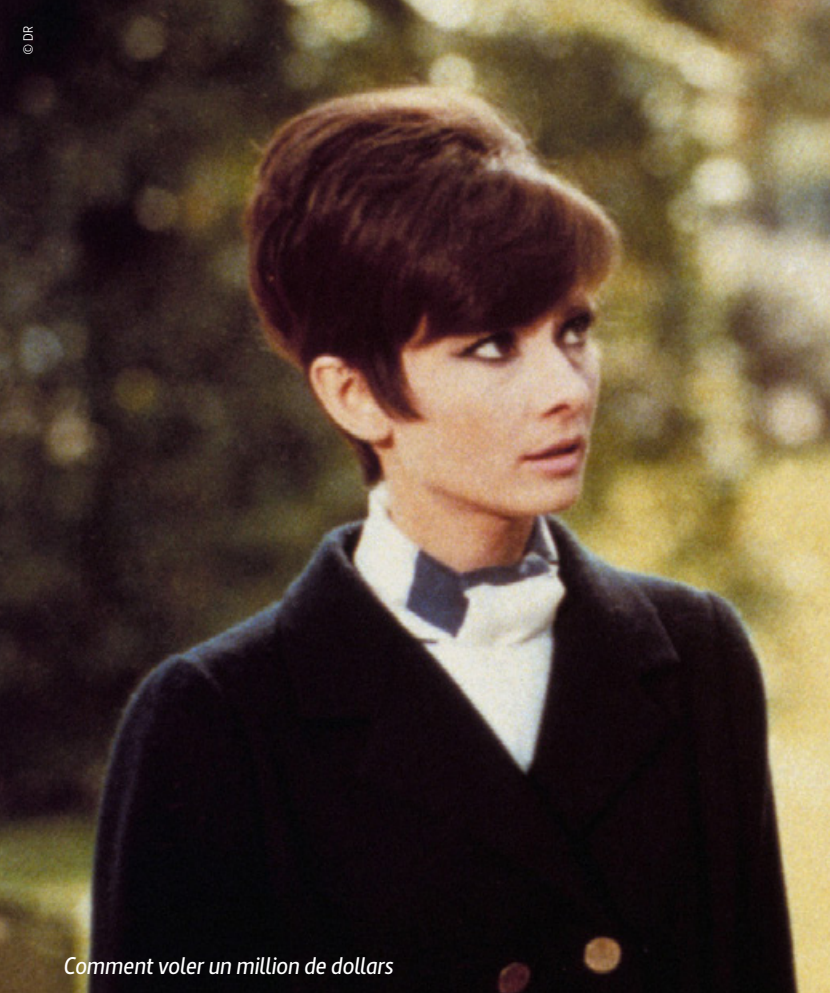
Comment voler un million de dollars