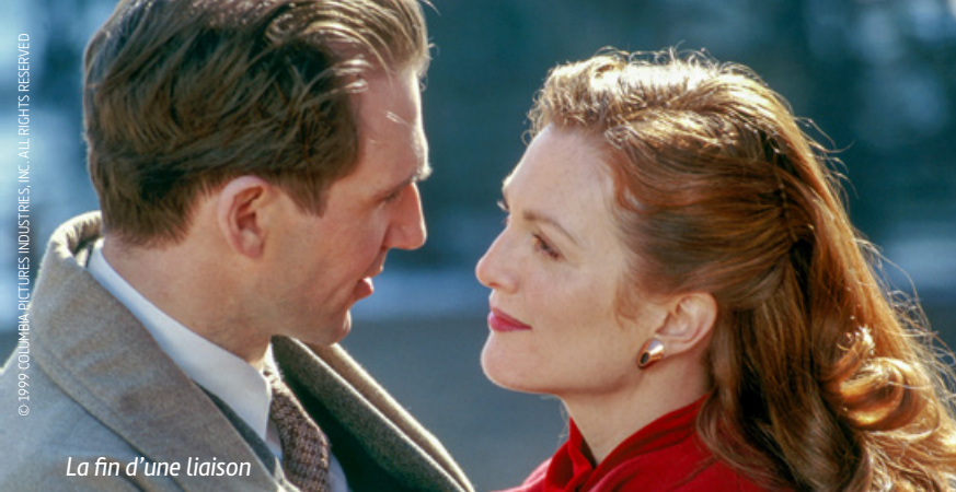
La fin d'une liaison