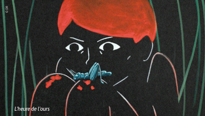
L'heure de l'ours