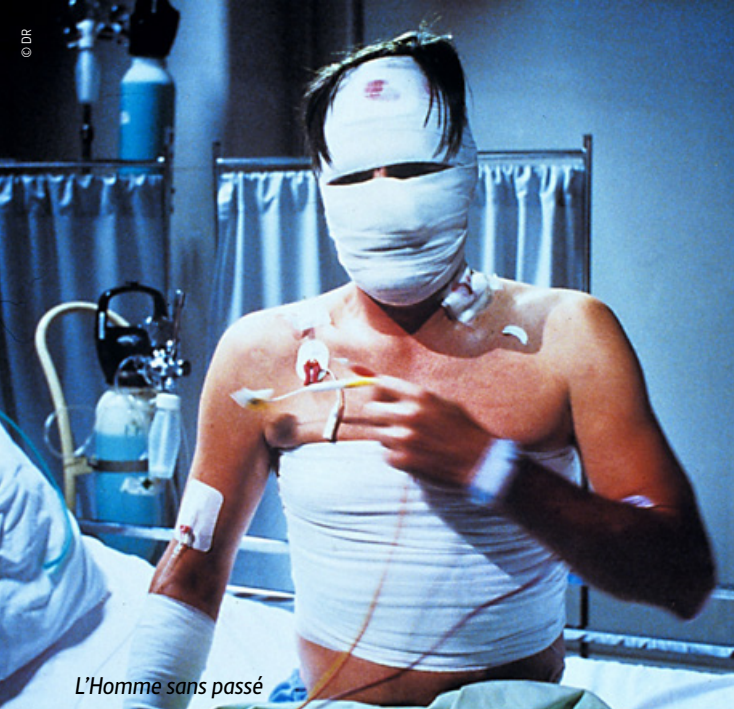
L'Homme sans passé