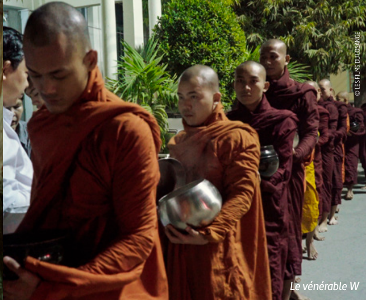
Le vénérable W