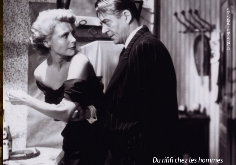
Du rifi chez les hommes