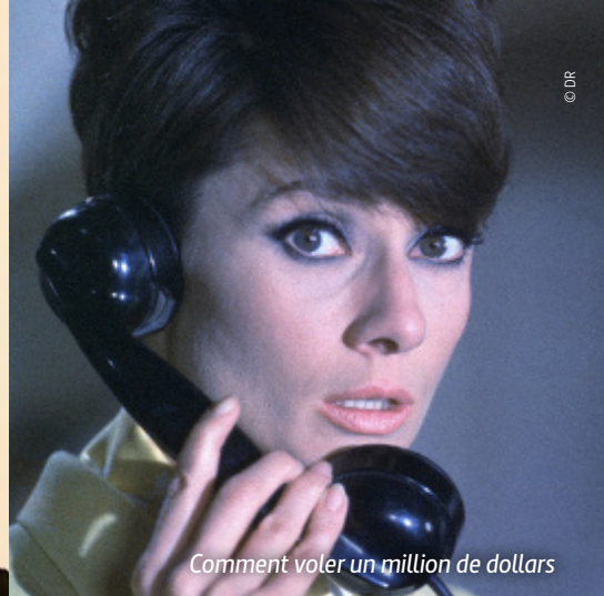
Comment voler un million de dollars