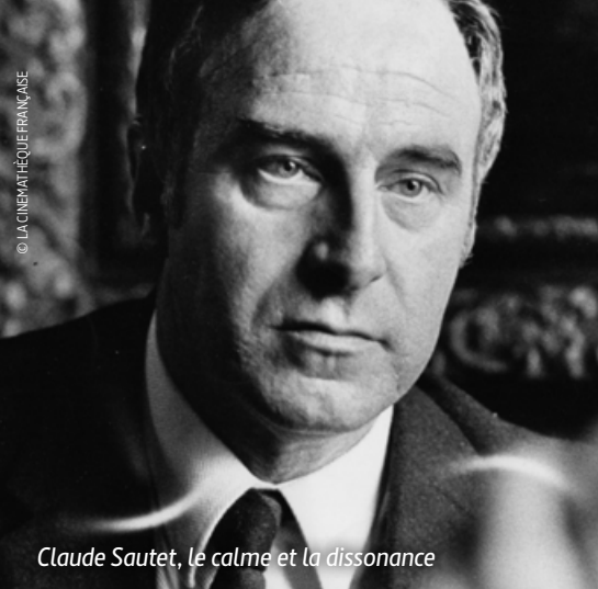
Claude Sautet, le calme et la dissonance