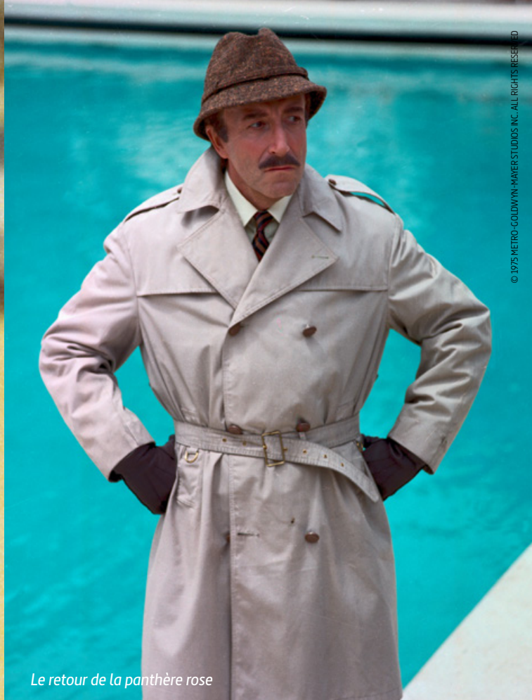
Le retour de la panthère rose