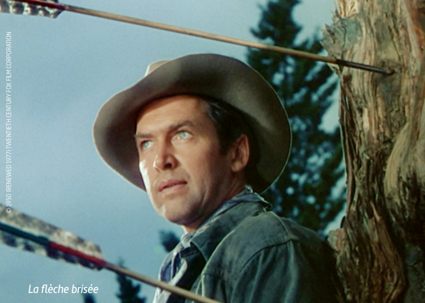
La flèche brisée