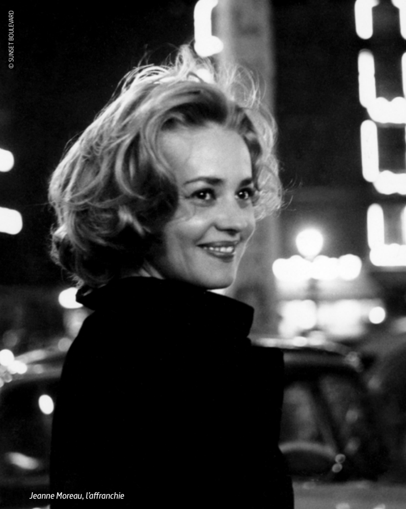
Jeanne Moreau, L'affranchie