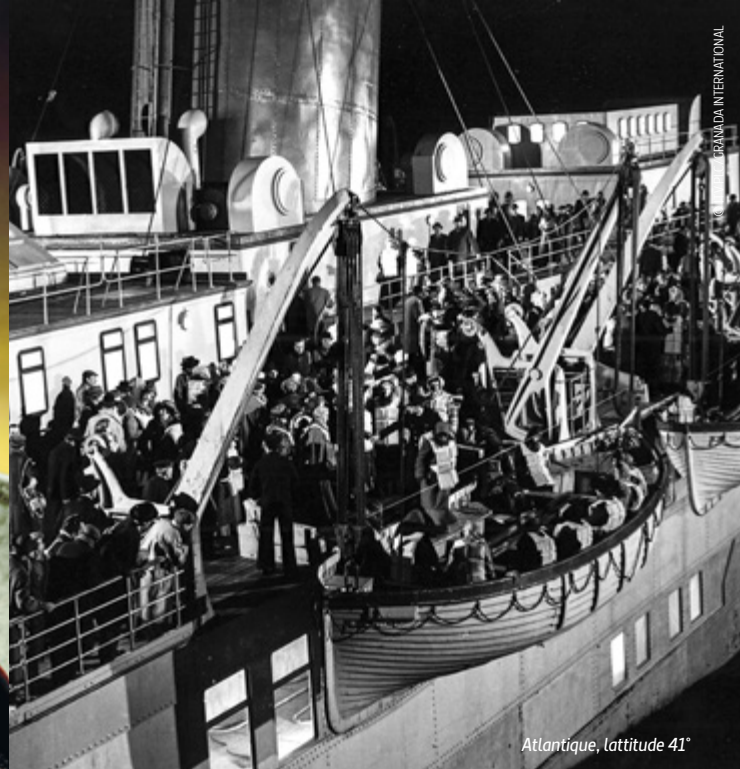
Atlantique, latitude 41°