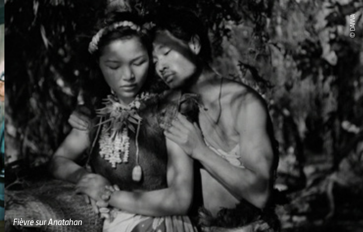
Fièvre sur Anatahan