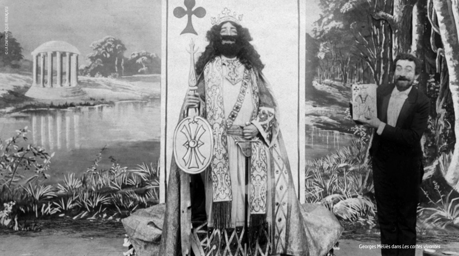
Georges Méliès dans Les cartes vivantes