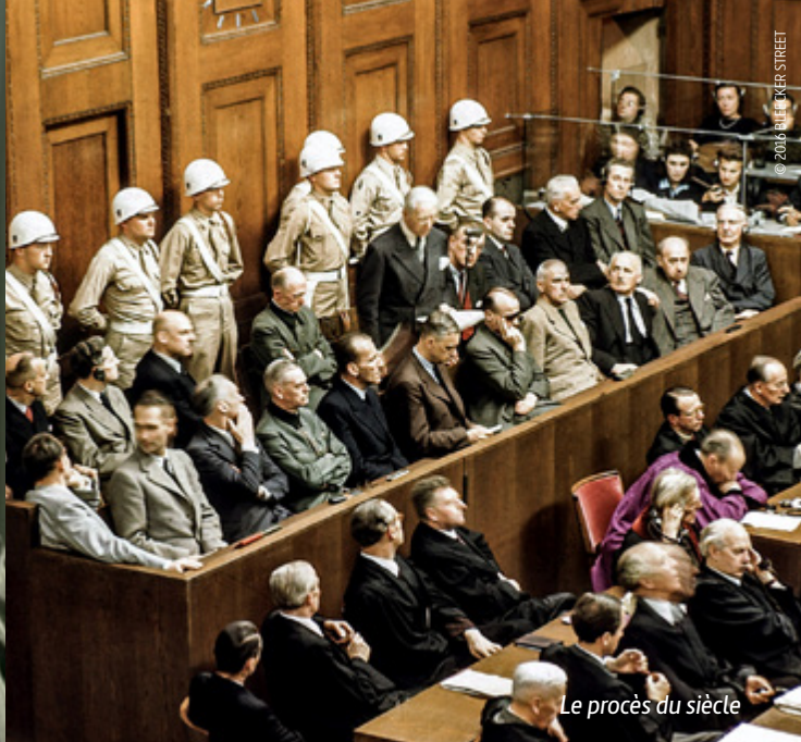
Le procès du siècle