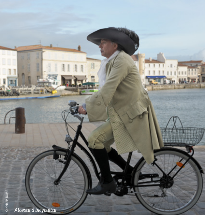
Alceste à bicyclette