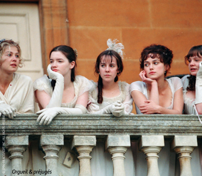
Orgueil & préjugés