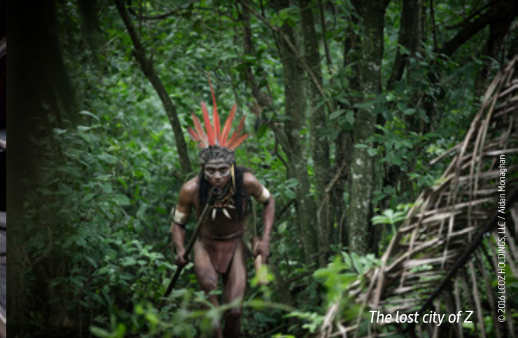
© 2016 COZHO/DINOS, LLC / Aigan Monaghan