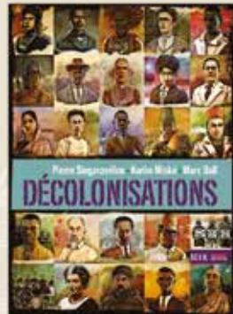
DÉCOLONISATIONS DE PIERRE SINGARAVÉLOU, KARIN MISKE ET MARC BALL