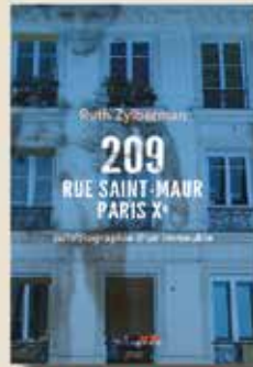
209 RUE SAINT-MAUR PARIS X' AUTOBIOGRAPHIE D'UN IMMEUBLE DE RUTH ZYLBERMAN