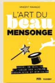
L'ART DU BEAU MENSonge MANUEL DE QUALITÉ À L'USAGE DES SCÉNARISTES DE VINCENT RAVALEC