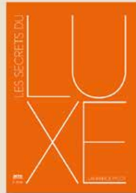
LES SECRETS DU LUXE DE LAURENCE PICOT

SUR ARTEBOUTIQUE.COM LA BOUTIQUE EN LIGNE D'ARTE LES FRAIS DE PORT SONT GRATUITS DÈS 40 € D'ACHAT