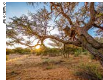
Série documentaire de Dereck et Beverly Joubert (Afrique du Sud, 2017, 5x43mn)