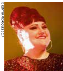
Présenté par Beth Ditto