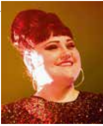
Présenté par Beth Ditto